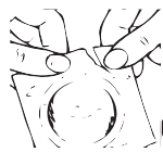
ציור מס' 1

5. את הקונדום המשומש יש לקשור ולהשליך לפח.