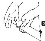
ציור מס' 2